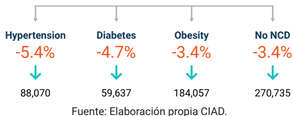
Figura 2. Cesación según condición de salud

La cesación también difiere según condición de salud. Un incremento en el impuesto específico al tabaco de $1 peso por cigarrillo provocaría una tasa de cesación de tabaquismo del 5.4 por ciento entre los fumadores con hipertensión por diagnóstico médico previo, 4.7 por ciento en los fumadores con diabetes por diagnóstico médico previo y 3.4 por ciento entre fumadores con obesidad (Figura 2). En términos absolutos, equivale a un total de 331,764 personas que dejarían de fumar. De estas, la mayoría serían fumadores con sobrepeso y obesidad (184,057), seguido de fumadores con hipertensión y diabetes (88,070 y 59,637 de manera respectiva).